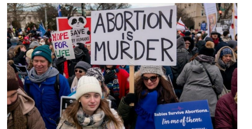
கருக்கலைப்புக்கு எதிர்ப்பு (ANSA)

அமெரிக்க ஐக்கிய நாட்டு கருக்கலைப்பு விவாதத்தில் ஐரோப்பிய பாராளுமன்றம் இணையக் கூடாது என்று, EU எனப்படும் ஐரோப்பிய ஒன்றியத்தைக் கேட்டுக் கொண்டுள்ள அப்பகுதியின் ஆயர்கள், இவ்விவகாரம் அப்பாராளுமன்றத்தின் சக்திக்கு அப்பாற்பட்டது என்று தெரிவித்துள்ளனர்.