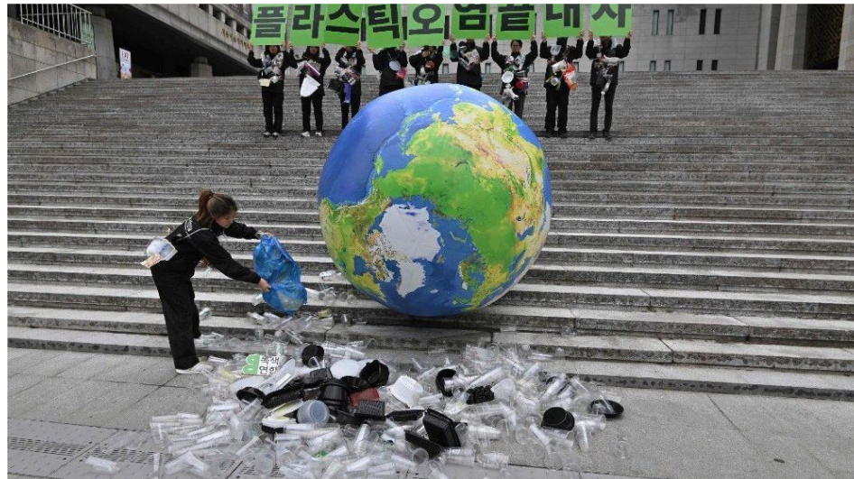
உலகை பாதிக்கும் நெகிழி (பிளாஸ்டிக்)

அறிவியலால் மட்டுமே மனித குலத்திற்கு நன்மை ஏற்படும், இயற்கைக்கு எதிரான அறிவியல் சிறிய நன்மையையும், பெரிய தீமையையும் கொண்டிருக்கும் என்பதை உணராமல் ஓடிக்கொண்டிருக்கிறோம்.