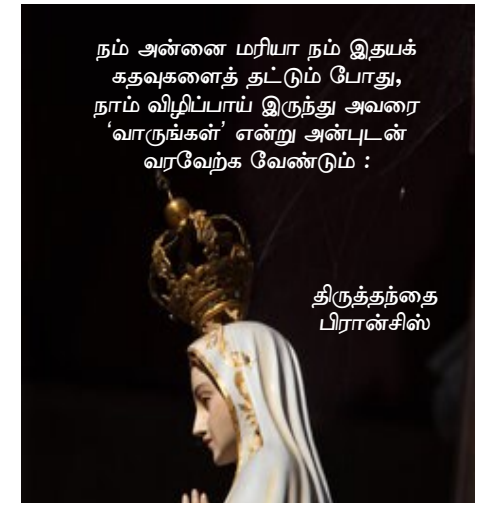
நம் அன்னை மரியா நம் இதயக் கதவுகளைத் தட்டும் போது, நாம் விழிப்பாய் இருந்து அவரை 'வாருங்கள்' என்று அன்புடன் வரவேற்க வேண்டும் :

நிறைவை நினைவுகூர்ந்துள்ள வேளை கொழும்பு கொச்சிக்கடை புனித அந்தோணியார் திருத்தலத்தில் உரையாற்றிய கர்தினால் இரஞ்சித் அவர்கள், உண்மையும் நீதியும் தூக்கி எறியப்பட வேண்டிய விளையாட்டுப் பொருட்கள் அல்ல என்றும், இரப்பர் பந்தை எப்படி நீருக்கடியில் எப்போதும் அமுழ்த்தி வைக்க முடியாதோ, அவ்வாறே நீதியையும் மறைத்துவைக்க முடியாது என்றும் விளக்கினார்,