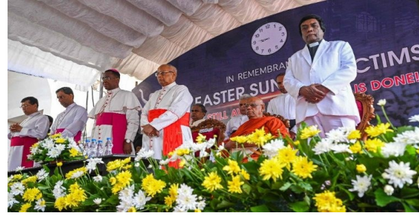
குண்டுவெடிப்பில் இறந்தவர்களுக்கு அஞ்சலி!

இலங்கை கத்தோலிக்கத் தலத்திருஅவை அதிகாரிகள், ஏப்ரல் 21-ஆம் தேதி உயிர்ப்பு ஞாயிறு குண்டுவெடிப்பின் ஐந்தாமாண்டு நிறைவை நினைவுகூர்ந்துள்ள வேளை, பாதிக்கப்பட்டவர்களுக்கு நீதியை உறுதிப்படுத்த பாரபட்சமற்ற மற்றும் நியாயமான விசாரணைக்கான கோரிக்கையை மீண்டும் வலியுறுத்தியுள்ளனர் என்று தெரிவிக்கிறது யூகான் செய்தி