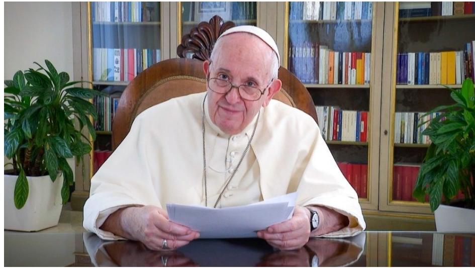
செயல்கள் அனைத்திற்கும் வெளிப்படைத்தன்மையுடனும் கூர்ந்தறியும்

இந்தச் செயல்முறைக்குள் நாம் ஒவ்வொருவரும் அவரவர் வழியில் நுழைய வேண்டும் என்றும், ஆனால் அதில் உள்ள அழிவுகரமான மற்றும் மனிதாபிமானமற்ற